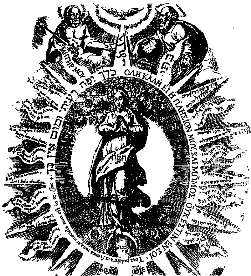
La Sophia céleste

conservé plus longtemps. Mais, à peine avions-nous commencé à marcher ensemble, que la mort nous l'a enlevé. »